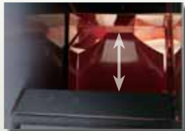
Funktion der Reinigungsklappe

Der Auswurfschacht kann einfach und schnell durch einen Hebel vom Sitz aus entleert werden. So wird ein Rückstau von Schnittgut im Auswurfkanal vermieden.